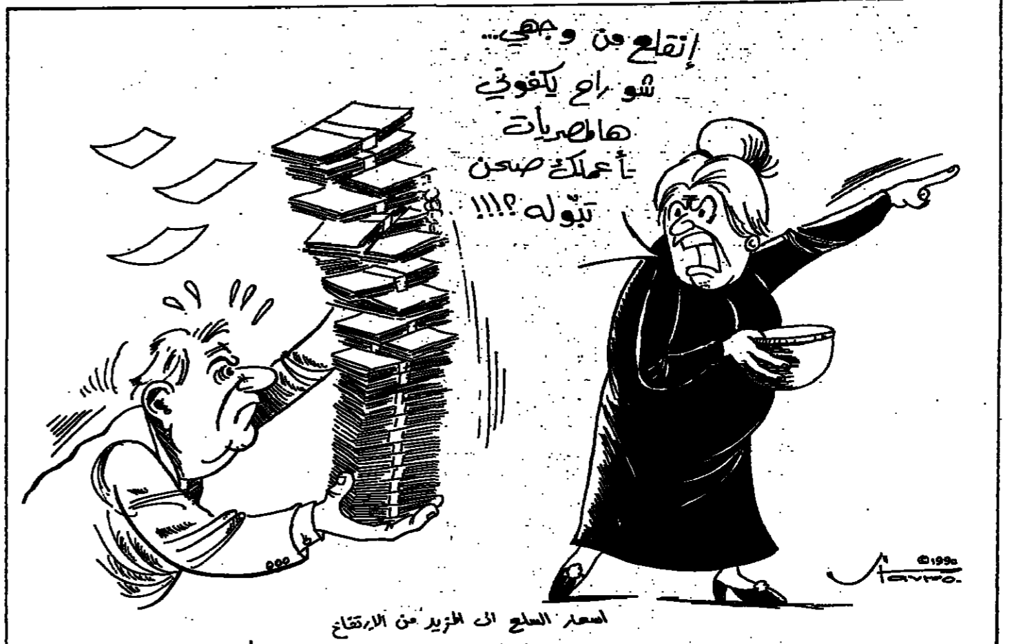
أسعار السلع انخفضت كثيرا منذ بداية العام

دخل اللبنانيون، مجددا، حلقة الفقر نتيجة الحرب المدعومة، ويات ليظن، حكما، في عداد الدول ذات الدخل المنخفض... وحتى، في دول شبه العمومية.